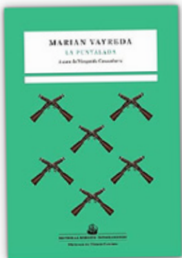
'La punyalada' de Marian Vayreda en l'edició de 2021 de l'Editorial Barcino.